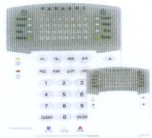
La centrale MG5000 gestisce fino a 32 canali

www.serviziolettori.it - (02) 90 90 90 automazione controllo controllore logico