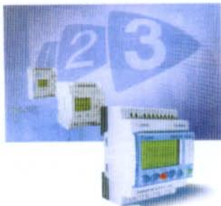
Millennium 3 è caratterizzato da facilità d'impiego, modularità e software innovativo

Disponibile in versione compatta per le automazioni semplici o versione espandibile fino a 60 ingressi/uscite per prestazioni più elevate, Millennium 3 soddisfa una moltitudine di applicazioni: imballaggio, gestione accessi, distribuzione automatica, irrigazione, gestione pompe, controllo climatizzazione e riscaldamento... Più memoria, più facilità d'impiego, più modularità, Millennium 3 beneficia di tutte le innovazioni di un controllore logico di ultima generazione: display